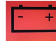
Ladepolekontrollleuchte: Strom kommt aus der Batterie