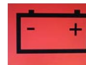
Ladekontrollleuchte: Strom kommt aus der Batterie